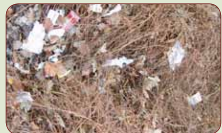
Zwerfvuil in de struiken op het Drilsmaplein

Terug naar ons, onze wijk: iedereen laat wel eens iets van een papiertje, blikje of zo, al dan niet per ongeluk op straat achter. Vaak worden vooral jongeren genoemd als de grootste vervuilers, maar ook ouderen veroorzaken zwerfafval, zo is 18% van de mensen die regelmatig zwerfafval veroorzaakt, 50 jaar of ouder. In navolging van Peter Smith van de Stichting Klean ( www.stichtingkleanworldwide ) wil ik mij echter vooral richten op de oplossing. Als iedereen in deze buurt zich nu eens voorneemt om elke dag minstens 1 stuk plastic op te rapen, is het probleem snel verholpen. Doet u mee????