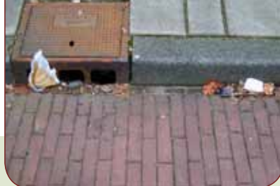
Zwerfvuil in de goot (Potgieterstraat)

Zwerfafval is een wereldwijd probleem. Veel verdwijnt uiteindelijk in de oceanen, dit afval wordt ook wel de plasticsoep genoemd omdat ze voor een