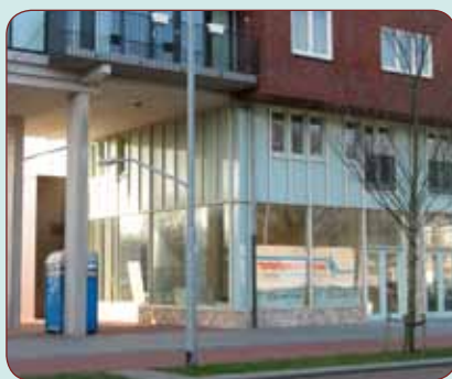
Het nieuwe pand op de begane grond van de Spits wordt momenteel ingericht voor het Buurtbedrijf.