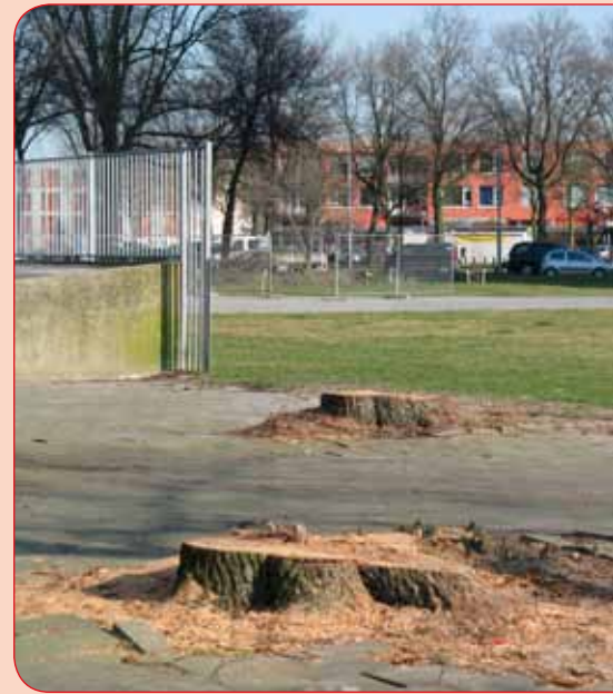
Een aantal monumentale bomen heeft al plaats gemaakt voor de nieuw te bouwen school.

Het door de WERKGROEP GROEN aangedragen fietspad langs de winkels aan het van Zeggelenplein is met de gemeente besproken. Dit naar aanleiding van klachten van winkeliers van overlast door fietsers en brommers tussen het winkelend publiek. Zij willen ook een verkeerstelling in de Nagtzaamstraat in verband met de naar onze mening toenemende drukte.