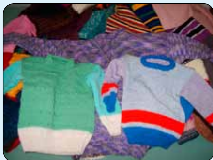
Door buurtbewoonsters gebreide kindertuien en lappendekens

In de vorige wijkkrant vroeg ik om hulp bij het in elkaar zetten van gebreide lapjes tot lappendekens. Een enthousiaste mevrouw heeft daarop gereageerd