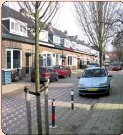
Jan van Walrestraat

"Het plantsoentje hier vlak bij vind ik wel prettig, wij noemen dat plantsoentje de hoge bomen. Maar om dan maar gelijk een nadeel te noemen, er ligt daar veel hondenpoep. Ook leuk zijn hier de jaren dertig woningen. De winkels in de Amsterdamstraat en op het van Zegge-